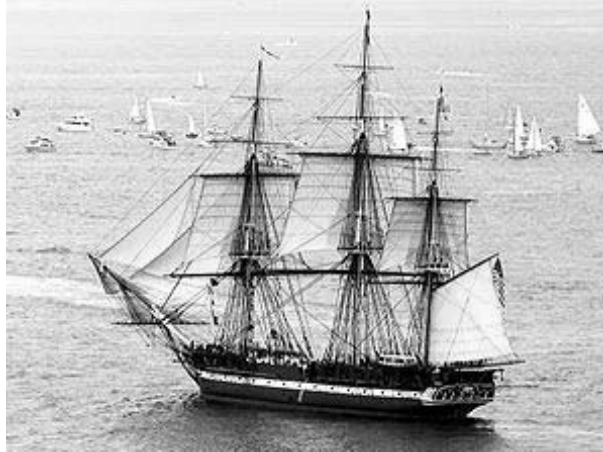
USS Constitution under sail in Massachusetts Bay, 21 July 1997.

1 USS Constitution is a wooden-hulled, three-masted heavy frigate of the United States Navy. Named after the Constitution of the United States of America by President George Washington, she is the oldest commissioned vessel afloat in the world. 2 Constitution , launched in 1797, was one of the six original frigates authorized for construction by the Naval Act of 1794 to be 3 the Navy's capital ships, and so Constitution and her sisters were larger and more heavily armed than the standard run of frigate. 4 Built in Boston, Massachusetts, her first duty with the newly formed United States Navy was to provide protection for American merchant shipping during the Quasi War with France and to defeat the Barbary pirates in the First Barbary War.